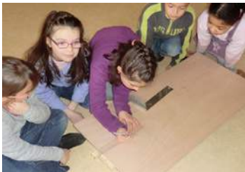
Construction du Push-Car