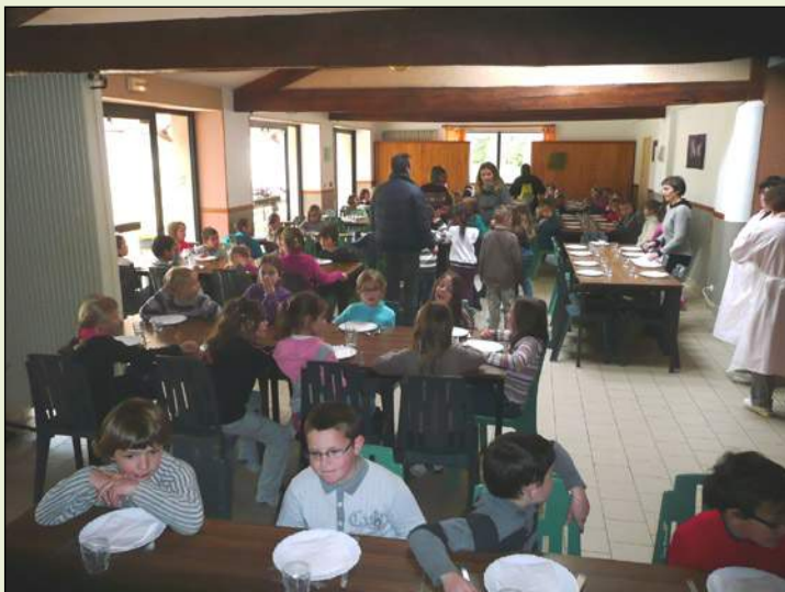
Repas au centre du Loup-Garou

Interrogation sur l'avenir de cette classe découverte du fait du désengagement financier du département : 8 € au lieu de 14 € et à partir de l'année prochaine, 0 € !!!