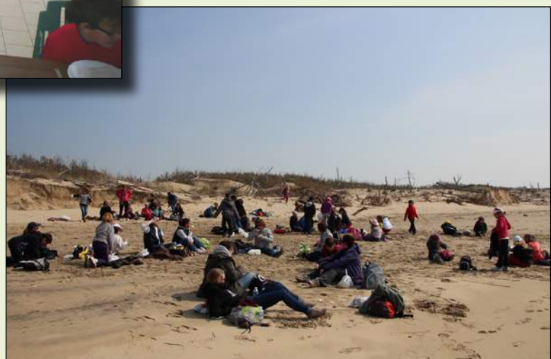
Sur une plage de Saint-Trojan, île d'Oléron