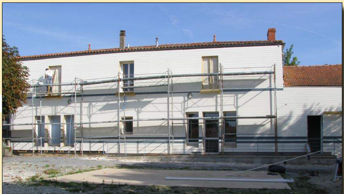
... et après la pose du bardage