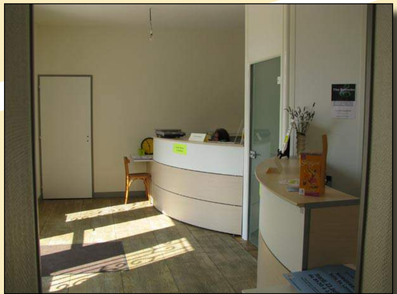
... et après aménagement