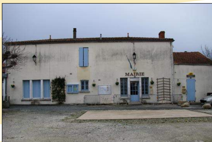
La façade de la mairie avant...