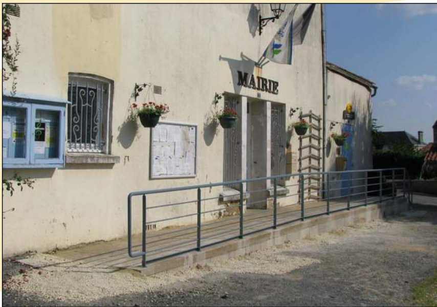
... après la création de la rampe d'accès