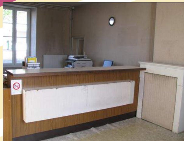
L'accueil de la mairie avant...